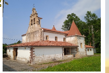
Iglesia Antigua Monasterio San Miguel de Quiloño (Época Alfonso III, Epígrafes Prerománicos)