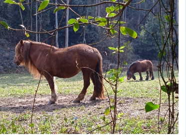
Caballos en el Camino