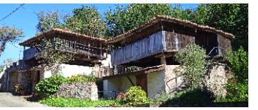
Conjunto de Hórreos La Siega