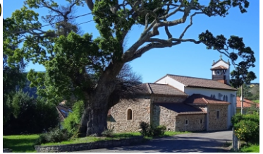
Iglesia de Santiago del Monte (Iglesia Santiago Apóstol, Reconstruida 1958, Roble Centenario, Arquitectura Popular, Hórreos, Paneras y Molino de Río)