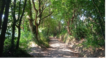
Bosque La Plata