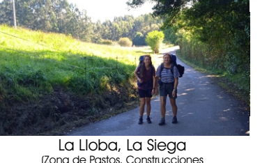
La Lloba, La Siega (Zona de Pastos, Construcciones Tradicionales Hórreos)