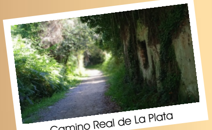
Camino Real de La Plata