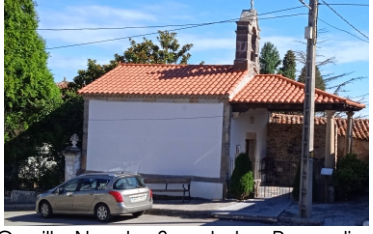
Capilla Nuestra Sra. de Los Remedios (Año 1719, Estilo Popular)