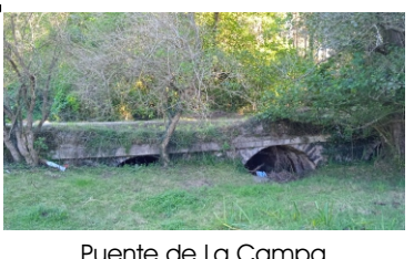
Puente de La Campa (Año 1876, Reconstruido, Río Ferrería)