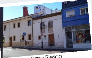
Casa Riesgo (Siglo XIX, Antiguo Ayuntamiento)