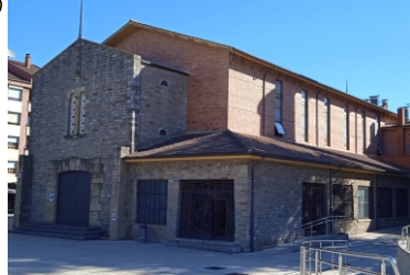
Iglesia Santa Mª Madre de La Iglesia (Inaugurada en 1966)